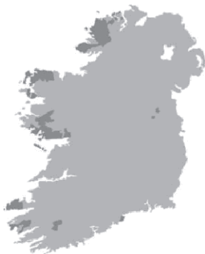
Figura 2. Localización de las gaeltacht en Irlanda

El siguiente mapa muestra la localización de las gaeltacht en Irlanda en las zonas más oscuras 19 .